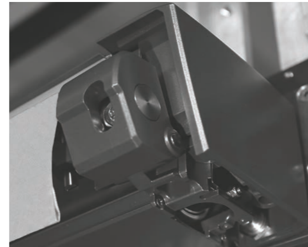
Erstklassige Produkte fortschrittlich gefertigt

Die besonderen Qualitäten und Eigenschaften unserer Produkte bestehen jeden Alltagstest.